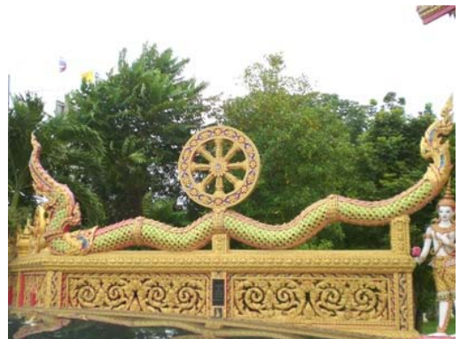
พญานาคหน้าซุ้มประตูวัดท่าไชยศิริ