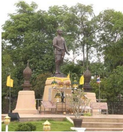
พระบรมราชานุสาวรีย์พระบาทสมเด็จพระจุลจอมเกล้าเจ้าอยู่หัว